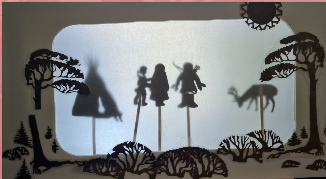
Ширма для теневого театра